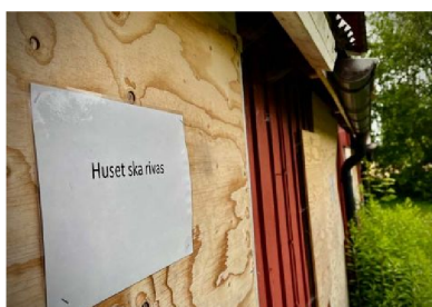
Fint laminerade skyltar är uppsatta på hela torpet. Men ingen information skvallrar om vem som är avsändaren.