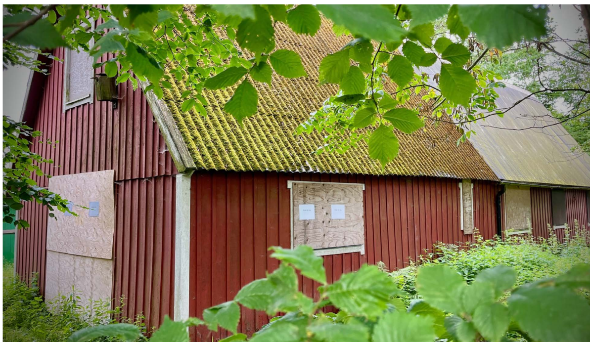
Kommunen äger torpet i Pålsjö skog. Sedan den sista boende lämnade 2014 har förfallet tilltagit.