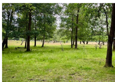
Gretas torp är det sista kvarvarande av torpen under Pålsjö gård. Där ett annat torp intill en gång låg finns inga spår kvar.